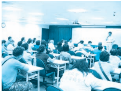
■ 98.05.09-認識精神分裂症及治療藥物