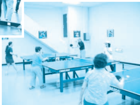
■ 98.06.24-心生活桌球健身活動