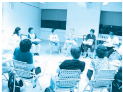
■ 98.08.03-說生命的光與愛—躁鬱症家屬成長團體