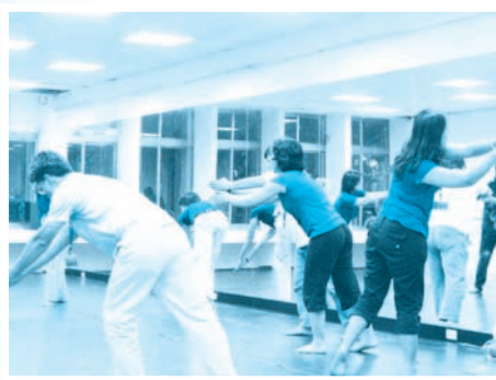
■ 98.06.18-舞蹈治療_當我們同在一起

「亂石、崩雲，驚濤駭浪。捲起千堆雪，捲起千堆雪。」「江山如畫，一時多少豪傑。」……大江東去，傳唱不歇。