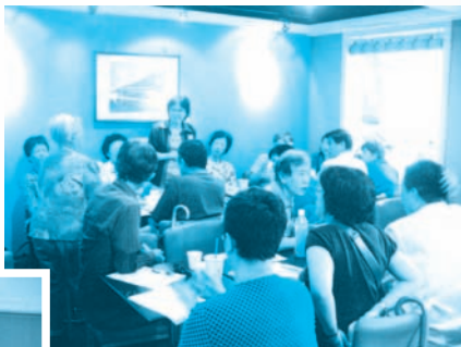
■ 98.08.17-照顧及服務需求討論會

2008年12月8日，民間團體擬定的《台灣身心障礙者權利宣言》出爐，由總統馬英九親自簽署，承諾確保身障者權利；在2009年7月1日開始，法律規定調高公、私立機關進用身障者比率，對於失業率是一般民眾四倍的身障者來說，有助於提升在權益保障及就業機會的部份。隨著各界人士的努力，身障者權益的需要漸漸的被發現、注重、到正視這些需求，雖然是一條漫長的路，但是都能獲得點滴的成果。在這樣的努力過程中，我們要大聲的提醒總統、官員、立法委員、台灣社會，精神障礙者不應該在身心障礙族群中還被排擠、被孤立，文明社會、人道國家，不應該讓精神病患者成為社會邊緣人！